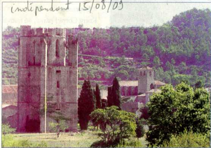
Lagrasse, une nouvelle fois au cœur d'une programmation culturelle pointue avec le festival Kunst corps Festival.

Lagrasse accueille, aujourd'hui et demain, Kunst corps, un festival trilingue et tridisciplinaire.